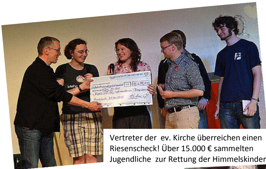
Vertreter der ev. Kirche überreichen einen Riesenscheck! Über 15.000 € sammelten Jugendliche zur Rettung der Himmelskinder.