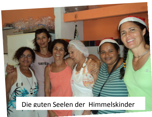
Die guten Seelen der Himmelskinder