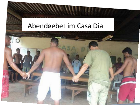
Abendgebet im Casa Dia