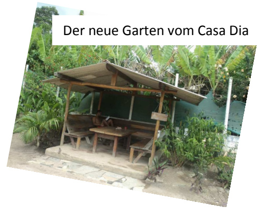
Der neue Garten vom Casa Dia