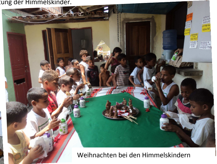
Weihnachten bei den Himmelskindern