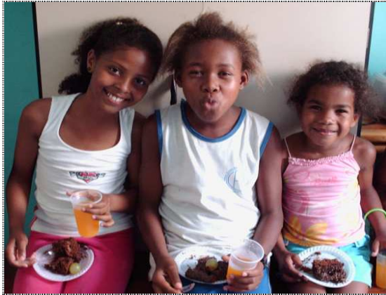
Freude über Kuchen und Limo auf der Geburtstagsparty

Ich bitte um Eure Zustimmung, die Verwendung der Spenden auf soziale und pädagogische Projekte in und um Arraial d'Ajuda auszuweiten. Mit Eurer Hilfe möchte ich dort Kinder und Jugendliche in Not unterstützen und die Chancen dieser jungen Generation verbessern.